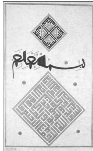
Religiöse Schriften von Ahmed Şemsettin Karahisari bearbeitet (16. Jh.)

Je nach Schriftstärke benannte man die Schriftarten sülü s, tevki , nesih , muhakkak , reyhani und rik'a . Nesih ist eine Schriftart, die man einfach lesen kann. Für Deckblätter benutzte man muhakkak und für kleine Notizen reyhani . Die bei Künstlern beliebtesten Schriftarten waren sülü s und tevki , rik'a dagegen wurde mit der Zeit weniger verwendet.