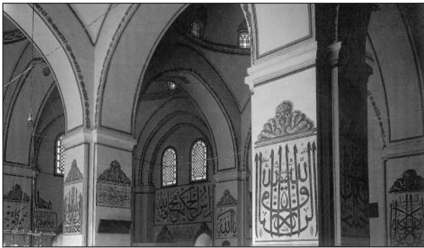
Ulucami in Bursa

Aufgrund des Bilderverbots im Islam gewann die Schriftkunst ( hat ) an Bedeutung. Wertvolle Erzeugnisse dieser Kunst haben auf Koranblättern sowie auf Wänden der Moscheen überlebt.