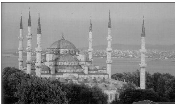
Sultan Ahmet Moschee oder Blaue Moschee

Dalgıç Ahmed Çavuş wurde 1598 Architekt des Sultans. Das einzige Bauwerk, welches er entwarf, war eine weitere türbe (1606) auf dem Gelände der Hagia Sophia: die Türbe von Mehmed III.