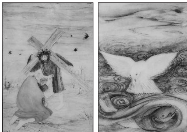
A. Lehmden: Kreuzweg und Schöpfung (auf Marmor)

Wir haben bei allen Umbrüchen dieser Zeiten den kirchlichen Namen St. Georg aber stets hoch gehalten, weil wir aus dieser Sendung heraus die Kraft erhalten haben, in manchmal wenig Hoffnung eröffnenden Entwicklungen immer wieder mit Zuversicht in die Zukunft zu schreiten. Erst kürzlich haben wir von der Schließung durch die französische Besatzungsmacht 1919 berichtet und die Wiedereröffnung in der türkischen Republik des Kemal Atatürk beschrieben, aber auch die schwierigen Zeiten des Deutschen St. Georgs-Kollegs von 1938 bis 1944 angesprochen sowie die damalige Hilfe unseres Bischofs Angelo Roncalli, die uns auch in die Internierung in Anatolien bis Weihnachten 1945 begleitet hat. Das alles durfte ich im ersten historischen Teil des Buches kurz zusammenfassend beschreiben und dabei an die profunde Fachkenntnis von Univ. Prof. Dr. Werner Jobst anknüpfen, der in einem einleitenden Teil die reichhaltige Geschichte von Galata wachruft und aufzeigt, welch umfangreiches kirchliches Leben hier schon seit byzantinischer Frühzeit bestand. Dem folgt dann noch die Neueinbindung in ein langsam sich entwickelndes österreichisches Auslandsschulwesen, vor allem aber auch in das sich rasant entwickelnde türkische Bildungssystem, sowie die Entwicklung der St. Georgs-Gemeinde.