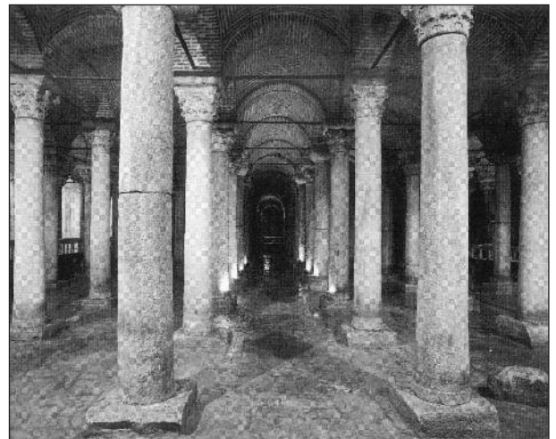
Basilika Zisterne (Yerebatan Sarayı)

In der Oströmischen (Byzantinischen) Epoche wurde Wasser aus den Bächen im Belgrader Wald in Wasserbassins gesammelt und über ein Rohrsystem streckenweise auf Aquädukten in die Stadt geleitet: z.B. in die Pantokrator Zisterne in Zeyrek.