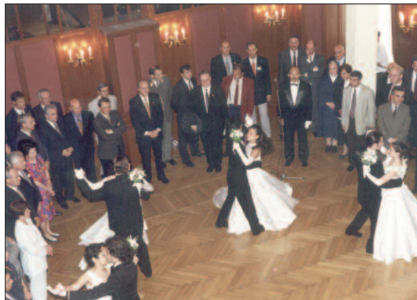
Bundespräsident Klestil und Ministerpräsident Yılmaz im Festsaal von St. Georg im Juni 1996

allem kirchliche Stellen in Österreich und Deutschland eine große finanzielle Hilfe leisteten. Neben den 60 Betten der verschiedenen Abteilungen steht vor allem ein ausgedehnter Ambulanzbetrieb der ärmeren Bevölkerungsschicht von Istanbul offen und wird seit Generationen von vielen Menschen geschätzt. So