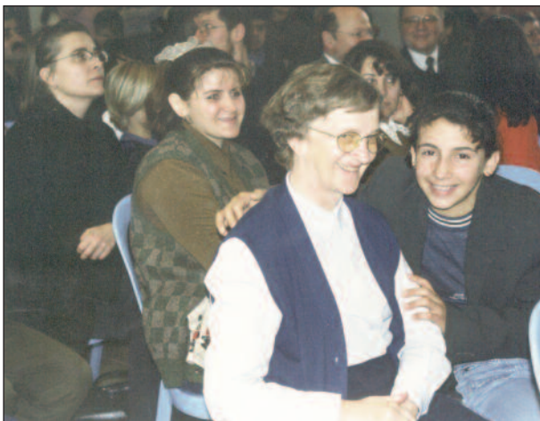
Weihnachtsfeier der Vinzenzgemeinschaft St. Georg für irakische Flüchtlingskinder 2001

Das St. Georgs-Krankenhaus steht immer wieder neu vor der Frage, wie "Barmherzigkeit" am besten glaubwürdig gelebt wird. Es ist dabei auch zu beachten, dass es auch die klare islamische Tradition in diesem Bereich gibt, wenn sie auch manchmal stärker auf die eigene Gemeinschaft