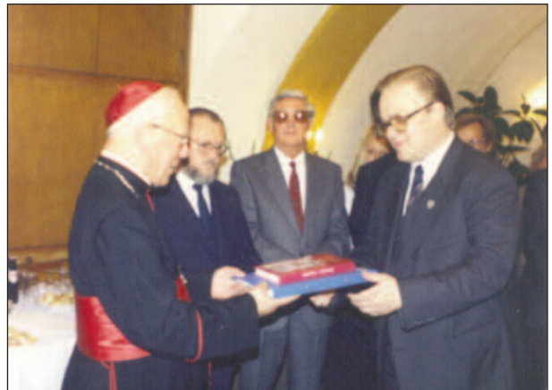
Erbischof Berg (Salzburg) und der damalige Metropolit Bartholomäus in St. Georg

Bemühung um eine offene Gemeinde, die natürlich auch mit manchen Gefährdungen verbunden ist. Erleichtert wird uns dies in St. Georg dadurch, dass wir mit einem Mitglied eines Säkularinstitutes eine Theologin als Seelsorgerin haben, die in manchen Bereichen einen besseren Zugang als herkömmliche Amtsträger findet. Gute ökumenische Kontakte sind uns hier sehr wichtig.