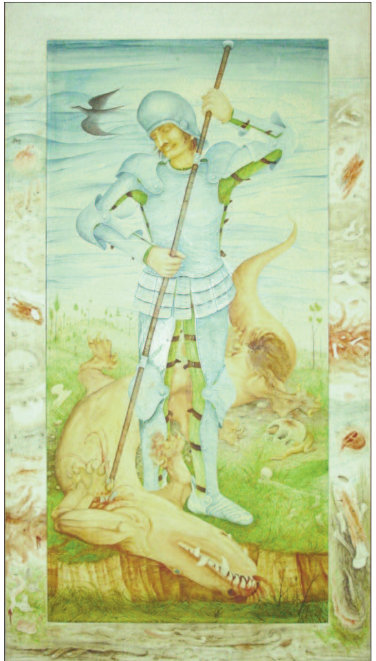
Hl. Georg. Gemälde des Kirchenpatrons von Anton Lehmden