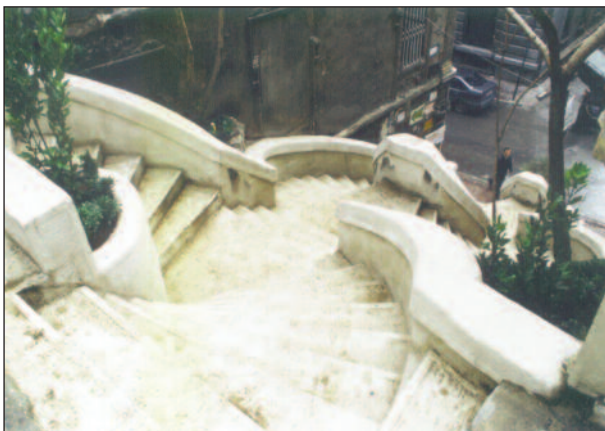
Unsere "Strudelhofstiege": Camondostiege zum St. Georgs-Kolleg