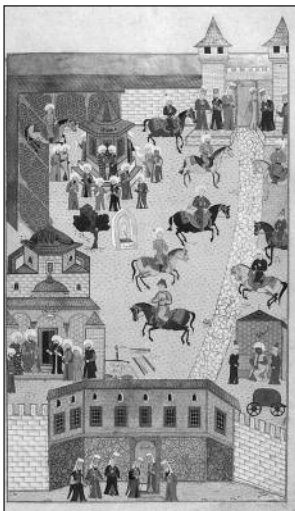
Ummauerung des Palasts

Einige Pavillone, wie ein Pavillon aus der Regierungszeit Bayezid II. (1481-1512), Mermer Köşk aus der Regierungszeit Yavuz Sultan Selim (1512-1520), Yalı Köşkü und İncili Köşk aus der Regierungszeit Murad III. (1574-1595) haben leider nicht überlebt.