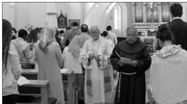
Gebet im Rahmen eines interreligiösen Treffens der franziskanischen Familie in Istanbul 2015

Konstantinopel, das heutige Istanbul, war der Austragungsort der ersten ökumenischen Konzile, aber auch Ort des Schismas mit den Kirchen des Ostens, das fast tausend Jahre nicht immer friedlich gelebt wurde. Diese schmerzlichen Ereignisse sind für uns eine Verpflichtung und eine Berufung zur Einheit. Die lokale Kirche unseres Vikariates Istanbul ist ökumenisch von der Berufung und der Sendung her. Für die Einheit der Christen zu arbeiten ist eine vorrangige Aufgabe, die wir zu erfüllen haben. Es wird daran schon gearbeitet und wir wollen diesen Weg fortsetzen. Ich möchte hier im Voraus mitteilen, dass das Motto, das ich für das bischöfliche Wappen ausgewählt habe, aus Röm 12,5 stammt: „So sind wir, die vielen, ein Leib in Christus“. Aus Platzgründen habe ich es im Lateinischen verkürzt: „Unum in Christo“.