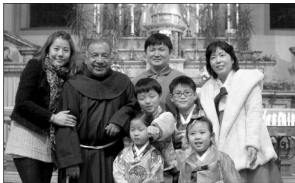
Weihnachtsgebet für Migranten 2013 in St. Maria (gemeinsam mit seinem koreanischen Mitbruder und der koreanischen Gemeinde)

Ich lebte zweimal in Rom, das erste Mal fünfeneinhalb und das zweite Mal elfeinhalb Jahre, also insgesamt siebzehn Jahre. In Istanbul – dem alten Byzanz und dann Konstantinopel – sind wir im Neuen Rom; damit will ich sagen, dass es Ähnlichkeiten im Leben der Kirche gibt: das Anerkennen der Kirche apostolischen Ursprungs zu sein; ein positiver Sinn von Tradition, der zu einer treu-