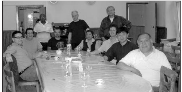
Besuch der Leitung der türk. Ordensgemeinschaften in der Hausgemeinschaft der Franziskaner 2013

Hiermit möchte ich mich auch bei den Verantwortlichen für den pünktlichen Dienst an unserer lokalen Kirche bedanken. Vielen Dank!