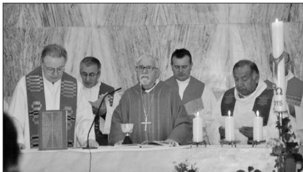
Georgsfest 2015 - gemeinsam mit Bischof Louis Pelâtre, Franz Kangler CM und Priestern des Vikariats

P. Ruben OFM wurde im April von Papst Franziskus zum neuen Apostolischen Vikar von Istanbul ernannt. Seine Bischofsweihe wird am 11. Juni 2016 um 19.00 Uhr in der Kathedrale St. Esprit in Istanbul stattfinden.