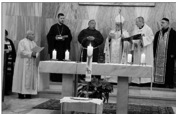
Gebetswoche für die Einheit der Christen 2016

Seit 2003 sind Sie nun schon in Istanbul in einer internationalen Gemeinschaft tätig, die ihren Schwerpunkt dem interreligiösen und ökumenischen Dialog widmet. An kaum einem anderen Ort sind so viele verschiedene christliche Konfessionen vertreten. Welche Aufgabe sehen Sie in diesem Bereich für die katholische Kirche in Istanbul?