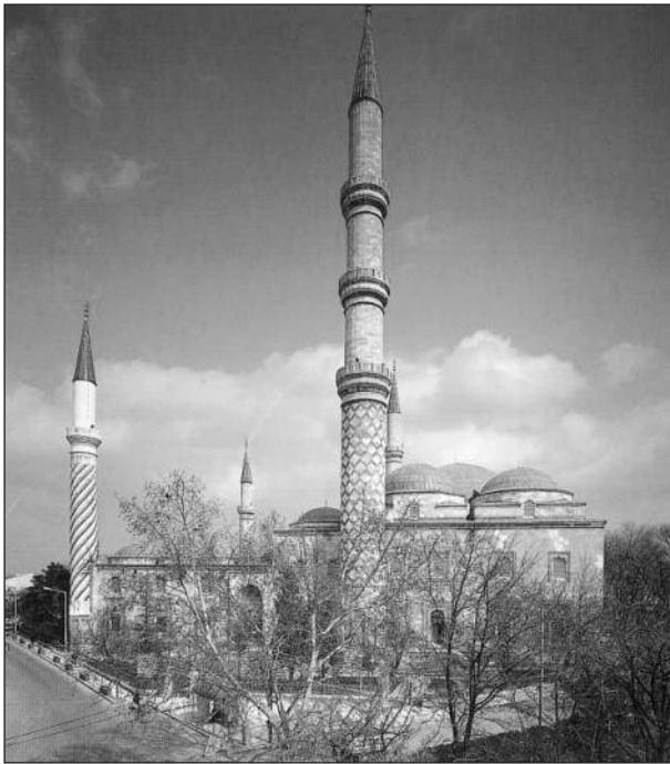
Üç Şerefeli Moschee in Edirne

Der im Janitscharen-Korps als Baumeister ausgebildete Sinan wurde 1538 zum mimarbaşı (Reichsarchitekt) ernannt. Bis zu seinem Tod im Jahre 1588 diente er 50 Jahre lang Süleyman I. und zwei folgenden Herrschern. Der aus dem armenischen Dorf Ağırnas bei Kayseri stammende Sinan kam schon 1513/14 zu den Janitscharen als er wohl erst 15 Jahre alt war.