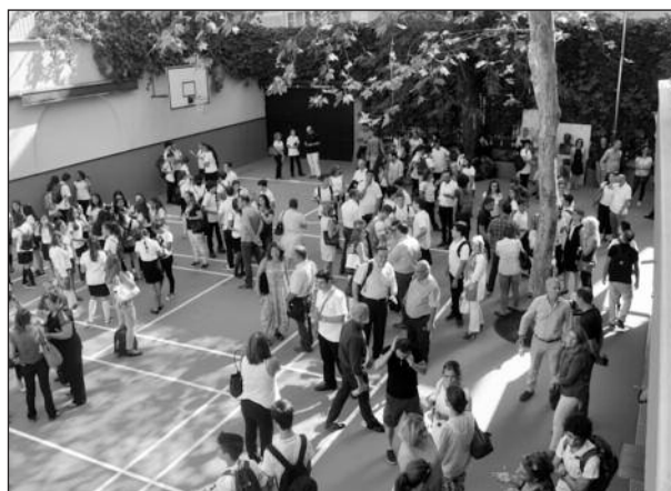
Die neuen Vorbereitungsklassen versammeln sich mit ihren Eltern im Schulhof.

Bevor sich kurz nach 10 Uhr der Schulhof leeren konnte, füllte er sich bereits wieder mit den nächsten Gästen, den Schülerinnen und Schülern der Vorbereitungsklassen in Begleitung ihrer Eltern. Die Aufregung war allen anzumerken . Herr Beşer hieß alle herzlich willkommen und die Schüler/innen wurden klassenweise aufgerufen. War eine Klasse fertig, machte sie sich von Englischlehrer/inne/n geleitet auf den Weg in ihren Klassenraum, wo ein Einstufungstest für das Fach Englisch auf sie wartete.