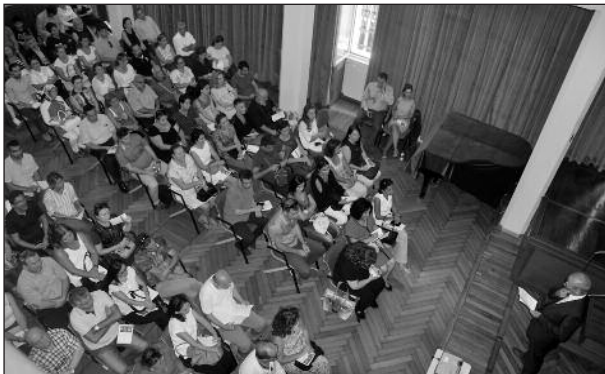
Erster näherer Kontakt zwischen Eltern und Schulleitung

„Sie wollen das Beste für Ihr Kind, auch wir wollen aus unserer Sicht das Beste für Ihre Kinder. Unser Blickwinkel ist dabei ein anderer, wir müssen die ganze Klasse, wir müssen die Schule als ein Ganzes im Blick haben. Ich kann hier und heute nur Werbung machen für eine gemeinsame Sicht . Die Schule ist eine Institution, sie ist aber auch ein gemeinsames Projekt, das mit jedem Schuljahr neu beginnt und das nur gelingen kann, wenn alle Beteiligten an einem Strang ziehen, die Schülerinnen und Schüler, die Lehrerinnen und Lehrer und ganz besonders auch Sie, unsere Eltern.“ Nachdem ich die Wichtigkeit der Rolle