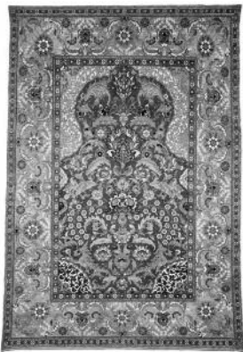
Seccade aus dem österreichischen Museum für Angewandte Kunst / Wien

1526 waren im Palast fünfzehn Teppich-Knüpfer tätig. 1545 schrumpfte die Anzahl auf zehn und 1558 sogar auf sechs. Sie konnten nur kleine Gebetsteppiche ( seccade ) herstellen. Beispiele für diese Teppiche kann man im Metropolitan Museum of Art / New York, Museum für Islamische Kunst / Berlin oder auch im Österreichischen Museum für Angewandte Kunst / Wien bewundern. Als man jedoch zum Beispiel den Teppichboden für die Süleymaniye Moschee brauchte, bekamen die großen Werkstätten in Kairo den Auftrag.