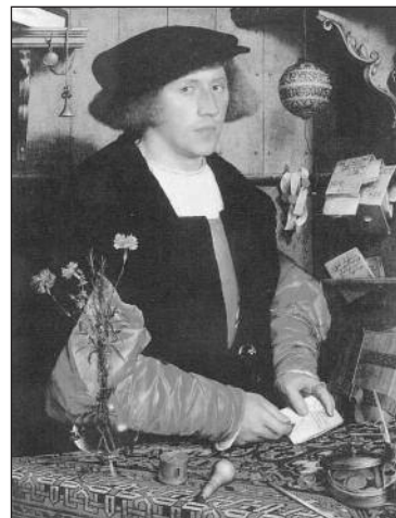
Holbein Gemälde, auf dem ein heute nach ihm benannter Teppich zu sehen ist.

Nächsten Monat: Kunst und Gewerbe im Palast 3: Fortsetzung Teppich und edle Stoffe