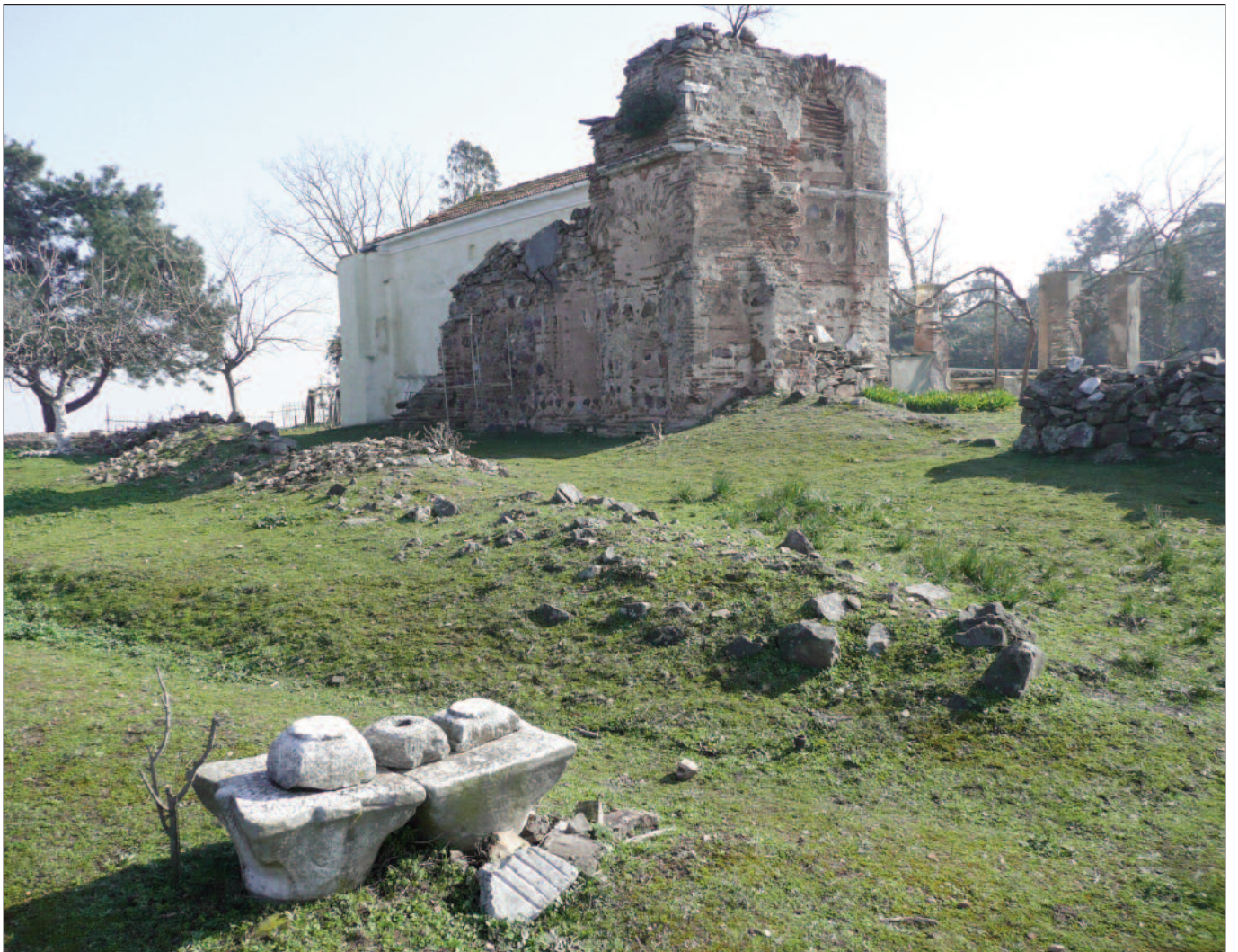
Metamorphosis-Kirche auf Burgaz mit Ruinen der älteren Kirchen