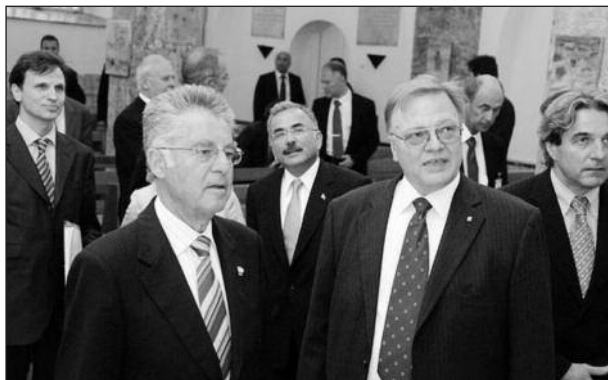
Begrüßung in der St. Georgs-Kirche