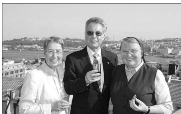
Auf der Terrasse des Spitals

Die Bootsfahrt nach der Ausstellungsöffnung bot auch Gelegenheit zur Kontaktaufnahme mit österreichischen Wirtschaftsvertretern, die versprachen, über das Stipendienanliegen für Absolventen des Kollegs nachzudenken.