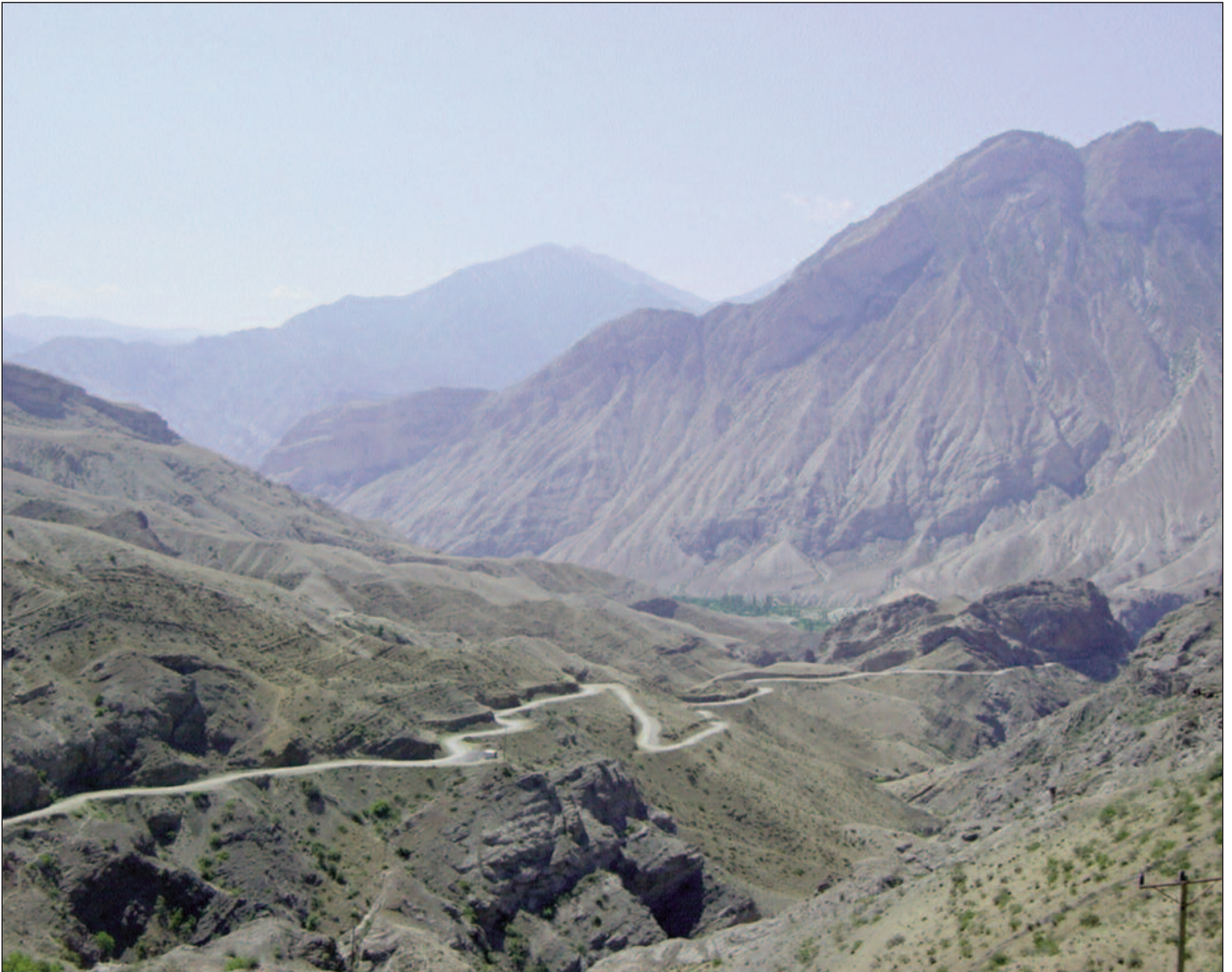
Weg zur Kathedrale von Işhan (Provinz Artvin)