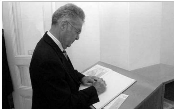
Eintrag ins Gästebuch der Galerie

Der Herr Bundespräsident betonte in seiner Antwort, dass ihm das Kolleg schon seit seinem letzten Besuch vor 10 Jahren vertraut sei und dass ihm bewusst sei, seit wie langer Zeit hier österreichische Kulturarbeit geschehe. Er sprach für diese Tätigkeit seine besten Wünsche aus und rief die Medienvertreter auf, über die Anliegen des Kollegs ausführlich zu berichten. Die Breitenwirksamkeit des Kollegs sei ja beachtlich. Beim Empfang in der österreichischen Botschaft in Ankara sei er bei einer größeren Zahl von Gästen darauf hingewiesen worden, dass es sich um Absolventinnen und Absolventen des Kollegs handle. Der Bundespräsident überreichte dann ein