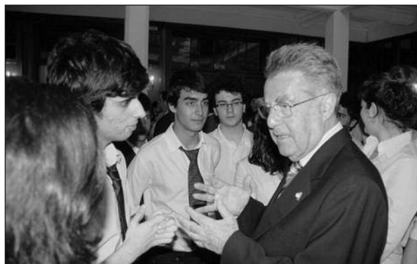
Im Gespräch mit den Schülern

Die beiden Außenministerien der Türkei haben im Juni 2005 auch einen Zusatz zu einem Memorandum