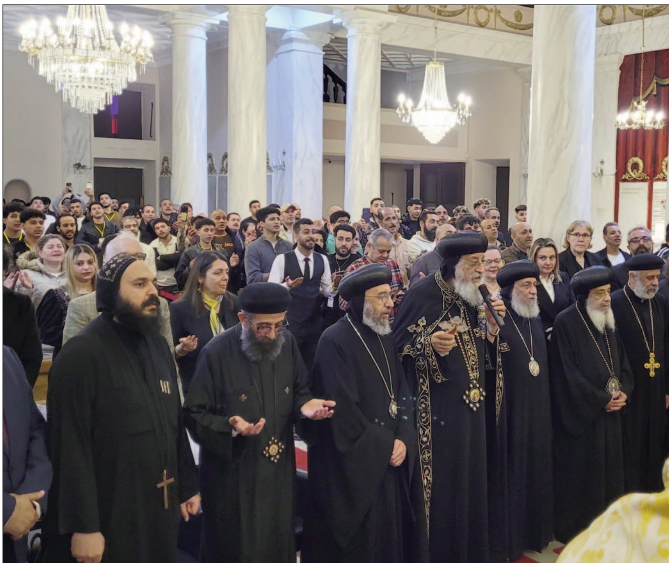
Papst-Patriarch Tawadros II. zu Besuch in Istanbul Große Ökumene und Stärkung der lokalen koptischen Gemeinde